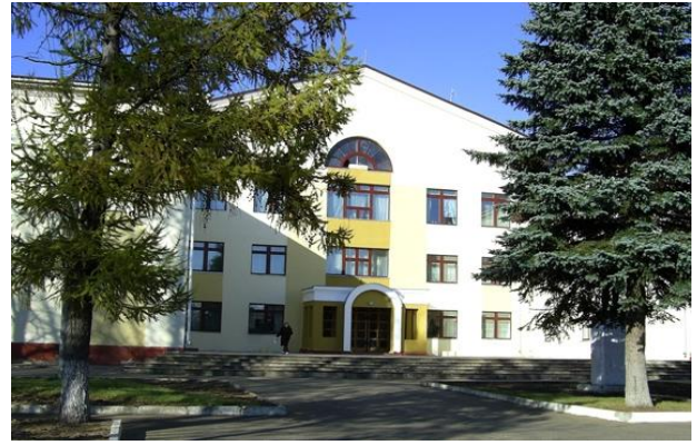
Памятник танкистам – освободителям города Дворец культуры