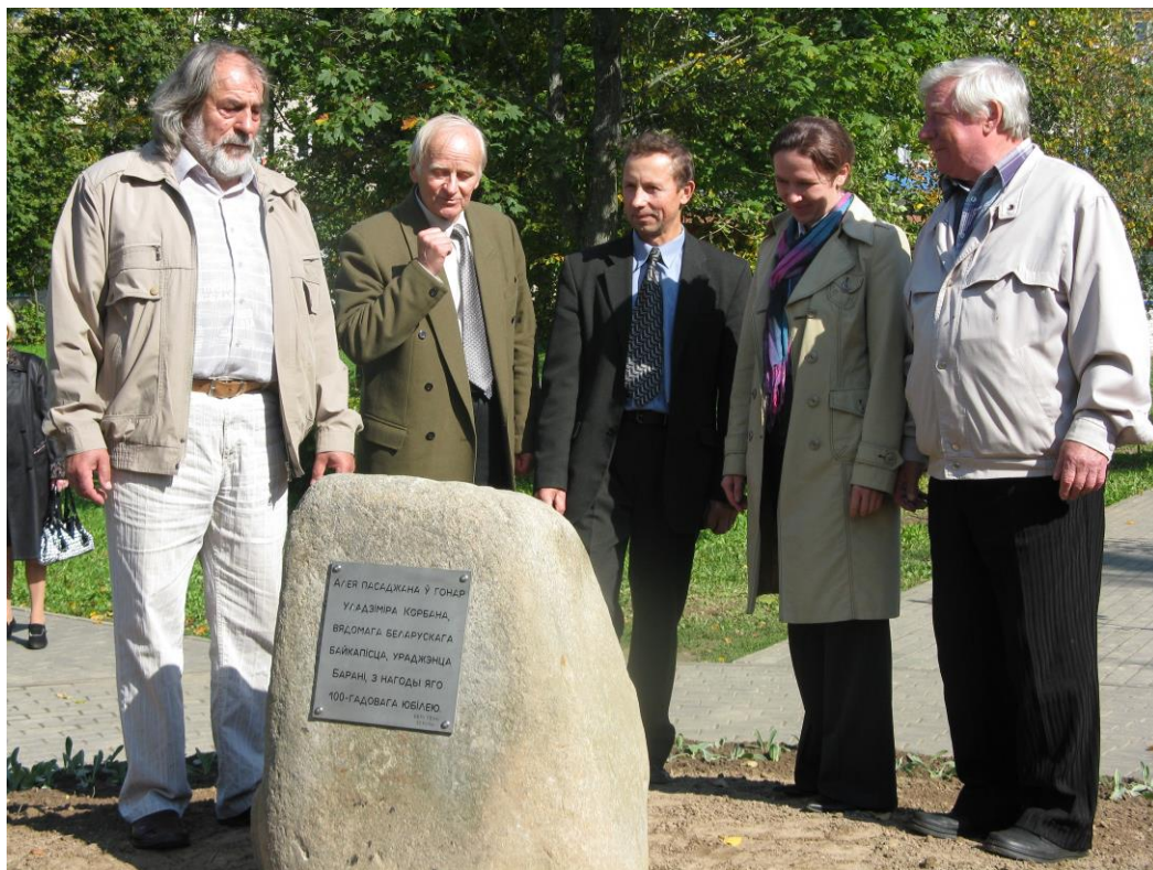
Мемориальная доска в честь Владимира Корбана

В городе проводятся значимые культурные мероприятия города – это проведение фольклорного фестиваля «Бараньскія музыкі» , в котором принимают участие ансамбли народной музыки и фольклорные коллективы из разных регионов республики, а также проводятся городские народные гулянья на Масленицу и Купалье . Но фольклор мало любить, мало собирать, его необходимо сохранить, возродить, вернуть в жизнь.