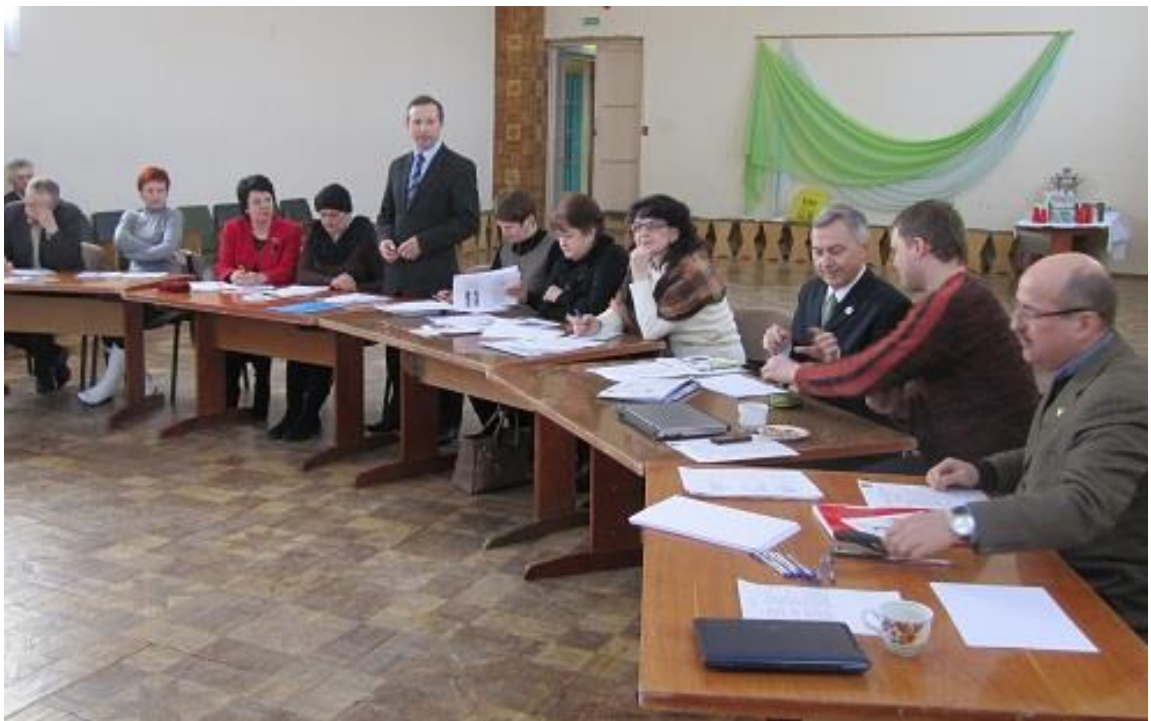
На семинаре-тренинге в Барани, март 2013 г.

Во время семинара-тренинга, состоявшегося в марте 2013 года был проведен SWOT-анализ по теме «Устойчивое развитие города Барань» (с акцентом на жилищно-коммунальные вопросы и энергосбережение) (см. Табл. 1). SWOT-анализ позволил выявить основные проблемы и направления работы в рамках Стратегии устойчивого развития. На этой основе в последующем планируется выработка предложений для возможных практических мероприятий (в том числе проектов). Важно при этом в процессе реализации Стратегии обеспечить увязку всех действий в единую логическую цепочку: «Стратегические цели (образ желаемого будущего) – Приоритеты (на основе SWOT-анализа) – среднесрочные и краткосрочные планы – Мероприятия». Одним из связующих элементов такой цепи является система индикаторов (показателей), которые фиксируются на этапе разработки стратегии (исходные индикаторы) и устанавливаются на конец каждого этапа реализации стратегии. Мониторинг изменения индикаторов позволяет оценить степень достижения поставленных целей, провести корректировку действий в направлении повышения их эффективности.