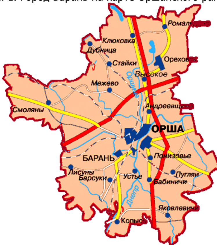
Рис. 1. Город Барань на карте Оршанского района

У города Барань, как и у большинства других городов Беларуси, есть своя история, которая своими корнями уходит глубоко в прошлое. Первое упоминание нашего населенного пункта относится в начале XVI века. Сказать, почему город получил такое название, точно нельзя. Известно только, что ещё с давних времён стоит он на тихих и живописных берегах реки Адров – правого притока Днепра, таящих в себе события давно минувших лет.