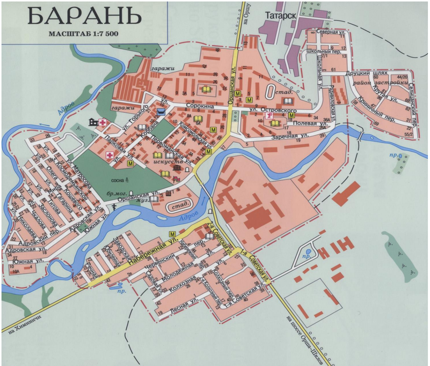
Рис. 2. План города Барань