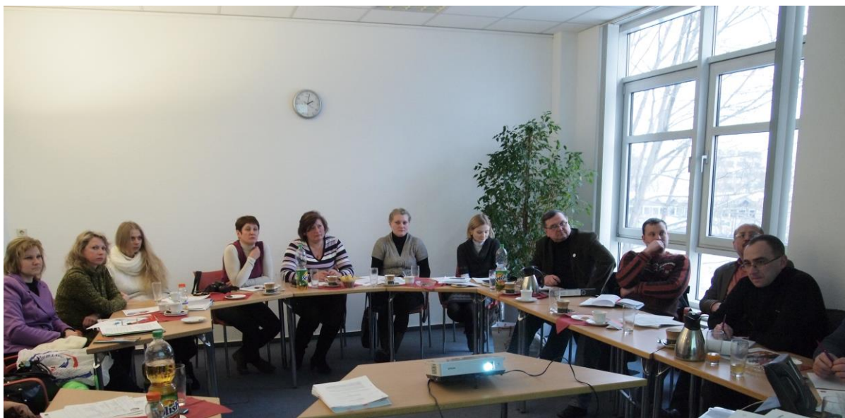
На семинаре во время обучающей поездки в Германию, январь 2013 г.

В рамках проекта представители города Барань в 2012 – 2013 годах приняли участие в консультационных совещаниях, а также в обучающей поездке в Германию. Это усилило потенциал местной инициативной группы по вопросам развития жилищной сферы и энергосбережению, позволило использовать немецкий опыт в работе.