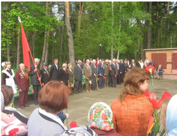
Чествование ветеранов 9 мая 2010г.