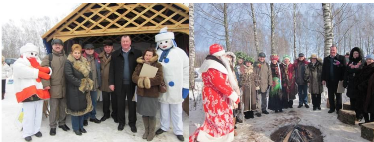
«Проводы зимы», 2012 г.

Список публикаций в СМИ о нашей работе в 2012-м году см. в Приложении 4.