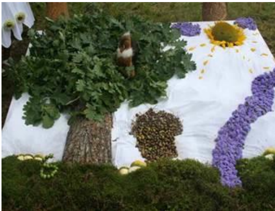
«Спадчына мая – старонка родная»

В этом году впервые на фестивале реализовалась идея, вошедшая в 2010 году в описание «образа желаемого будущего Желудка» и связанная с происхождением названия поселка от жёлудя: желающие могли купить саженцы молодых дубков, которые в будущем превратятся в могучие деревья и внесут свой вклад в поддержку биоразнообразия и устойчивое развитие.