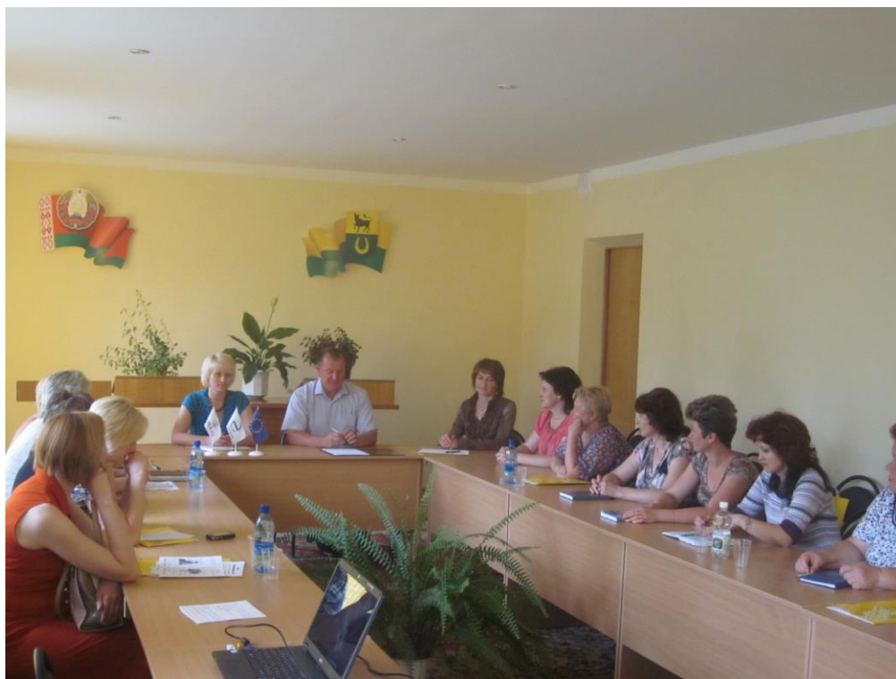
На семинаре «Энергосбережение в детском саду»

Так, например, с целью привлечения внимания населения Желудокского сельсовета к рациональному использованию ресурсов и развитию возобновляемых источников энергии планируется ежегодное участие 11 ноября в Международном дне энергосбережения (см. Приложение 6). Мероприятия в его рамках мы планируем проводить совместно с нашими партнерскими организациями.