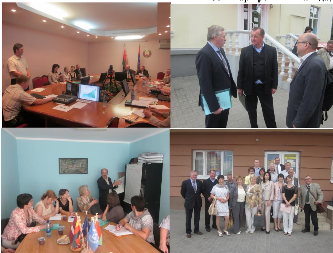
Семинар-тренинг в г.Лида, 2013 г.

Во время семинара-тренинга в г. Лида был проведен SWOT-анализ по теме «Устойчивое развитие Желудокского края с акцентом на жилищно-коммунальные вопросы и энергосбережение» (см. Табл. 4). SWOT-анализ позволил выявить основные проблемы и направления работы в обозначенных областях, а на их основе – предложения для возможных практических действий (в том числе – проектов).