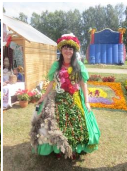
Победители номинации «Усадьба образцового состояния» и фестивальный шествие, 2013 г.