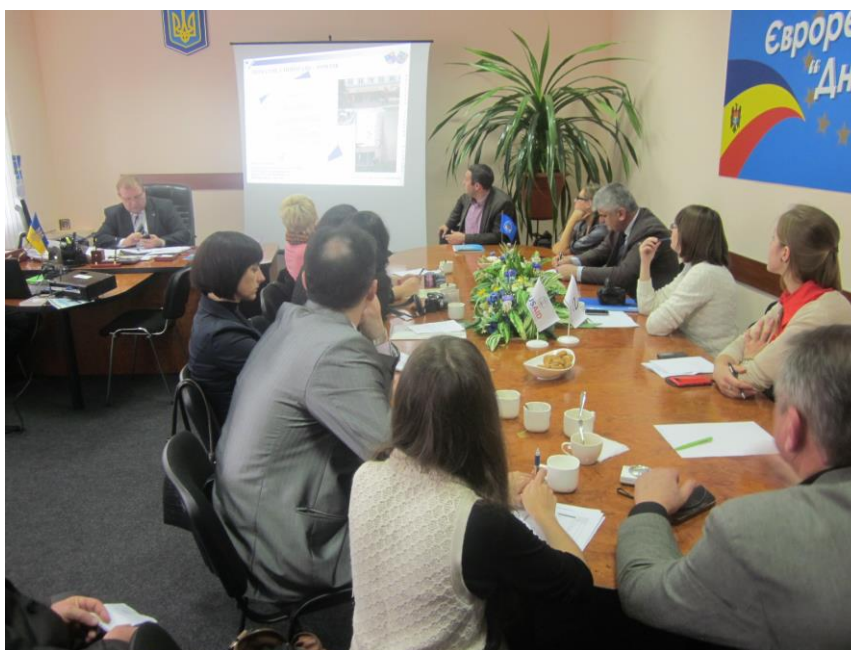
Визит в Украину, Молдову за опытом

Большой интерес у гостей и местного населения вызвали проведенные праздники Масленица и Купалле, областная выставка собак. В 2013 году представители инициативной группы по УР участвовали в проведении более 20 семинаров, встреч, круглых столов, на 13 – представляли собственный опыт работы по УР; участвовали в поездке в Украину и Молдову (в рамках проекта «Энергоэффективность: решаем проблемы вместе», реализуемого совместно с учреждением «Новая Евразия»).